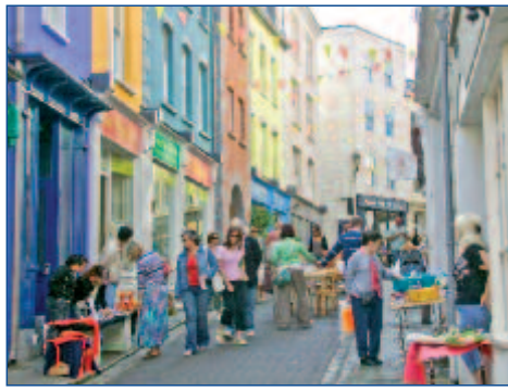
Shopping in St. Peter Port