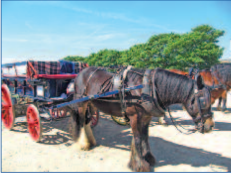
Pferdekutsche auf Sark