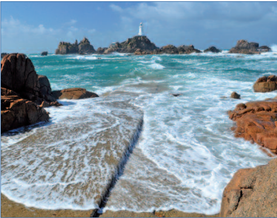
Leuchtturm La Corbière

A ufgrund der Lage am Golfstrom haben die britischen Kanalinseln ein „Klima, das für den Müßiggang wie geschaffen ist“ (Victor Hugo, 1855). Atemberaubende Küstenabschnitte und entzückende Fischerhäfen verzaubern jeden Besucher. Jersey, die größte der Kanalinseln, hält Englands Sonnenscheinrekord. Kilometerlange Sandstrände, dazwischen romantische Buchten und bunte Blumentepiche, wechseln sich ab mit Palmen und einer üppigen Vegetation im Inselinneren. Zahlreiche Küstenwege laden zu erholsamen Spaziergängen ein. Man kann sich kaum einen besseren Ort vorstellen, um sich in der frischen Meeresluft zu entspannen und vom Alltagstrott zu erholen. Dazu die Wärme und Freundlichkeit der Inselbewohner, die von einer wohltuenden Mischung aus britischer Gemütlichkeit und französischer Lebensfreude geprägt sind – entdecken Sie mit uns dieses ausgefallene Zielgebiet mitten in Europa. Britischer Lifestyle und französisches Savoir-vivre werden Sie noch lange begleiten.