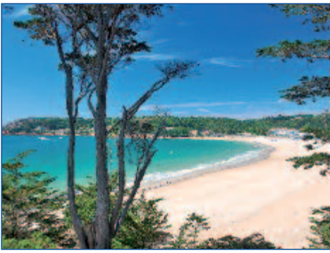
St. Brelades Bay