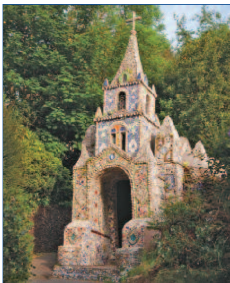
„Little Chapel“, die kleinste Kirche der Welt

In der Tat wirkt die zweitgrößte der Kanalinseln etwas verschlafener als ihre große Schwester Jersey – abwechslungsreiche Hügellandschaften mit einer vom Klima verwöhnten Vegetation, weiße Sandstrände mit wogendem Dünengras und imposante Steilklippen mit herrlichen Aussichten bezaubern jeden Besucher. Nach der Fähüberfahrt erwartet Sie ein grandioser Anblick: der berühmteste Hafen der Kanalinseln empfängt Sie in Guernseys fantastischer Inselhauptstadt St. Peter Port. Bei einem geführten Stadtrundgang durch die verwinkelten Kopfsteingassen genießen Sie das unverwechselbare Flair des charmanten Städtchens. Am Nachmittag unternehmen Sie eine Inselrundfahrt Richtung Norden - die ungezählten Buchten sind noch genauso malerisch wie 1883, als Auguste Renoir sie in Öl malte. Das Inselinnere besticht durch verträumte Täler, meterhohe grüne Hecken, efeuberankte Steinmauern und wunderschöne Gärten. Dort erwartet Sie „Little Chapel“, die kleinste Kirche der Welt. Sie wurde als Miniaturausgabe der Kirche von Lourdes erbaut und ist mit Muscheln,