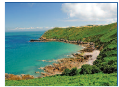
Grün bewachsene Felsküsten

30.05. BIS 06.06.2012 • FLUG AB/AN STUTTGART • AB € 1.588,- P.P. IM DZ