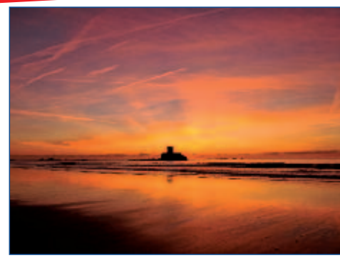
Sonnenuntergang über dem Atlantik